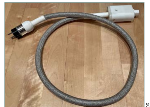
Pranawire Cosmos Lightspeed SE Bocchino.