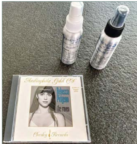
Traitement CD Essence of Music.

V&A : En termes de résultats sonores, à quel niveau places-tu l'ensemble que tu nous proposes d'écouter ?